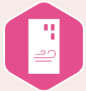
Indoor air quality